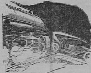
El año pasado murieron 23,200 personas, y 400,000 fueron lesionados en accidentes automovilísticos en los Estados Unidos, 80 por ciento de ellos con algún descuido.

Todos somos descuidados alguna vez y hay personas que lo son siempre. En la vida diaria los descuidos ocasionan enfermedades, accidentes, y aún la muerte; en el comercio causan pérdida de clientela, de tiempo y de dinero.